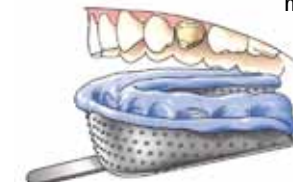
Afdrukkelpel met afdruk materiaal

Vervolgens maakt de tandarts een afdruk van uw hele kaak of het gedeelte waarin zich de afgeslepen kies bevindt. Hiervoor brengt de tandarts een afdrukkelpel met een rubberachtige massa in uw mond. Zo ontstaat een afdruk waarin later in een tandtechnisch laboratorium gips wordt gegoten. Op dit gipsmodel wordt de kroon of brug gemaakt.