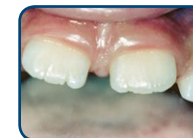
Tanden van het blijvend gebit hebben een kartelrand